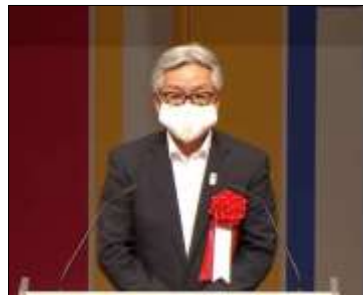
来賓 根本 洋治 牛久市長