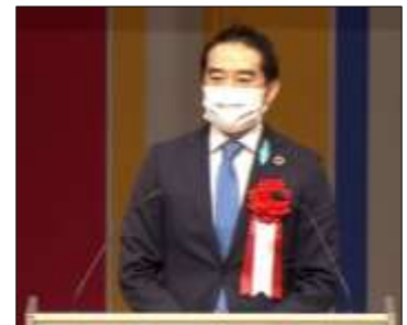
来賓 五十嵐 立青 つくば市長